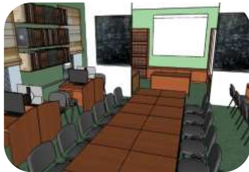
Переоборудованная библиотека Лицея