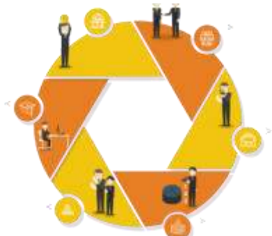
Сеть образовательных организаций (21 школа)