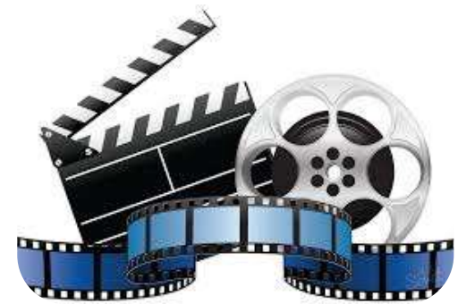
Видеоролик по результатам проекта