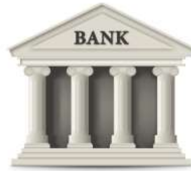
Создание банка информационных и методических ресурсов